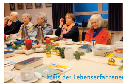
Kreis der Lebenserfahrenen