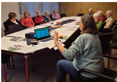
Frauentreff: Thema Weltgebetstag