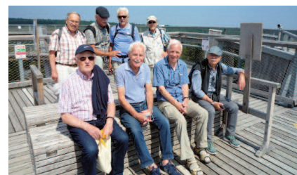
Männerkreis am Bodensee